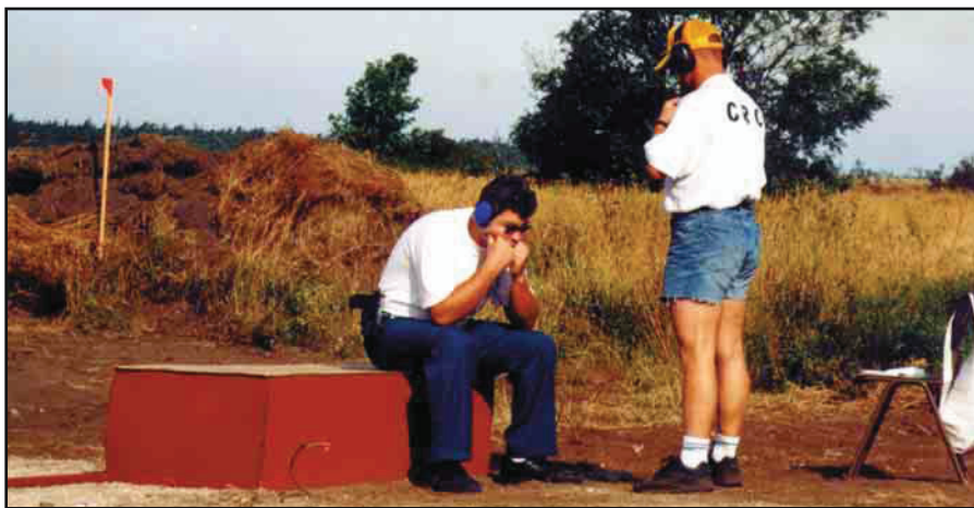
A 95-ös Európa-bajnokságot (Svédország) köcsöntokkal, pólóval, öltönynadrággal és cipővel kezdték a csomag eltűnése miatt. „A gond nem jár egyedül.” Persze, ha a löfeladat ilyen pozícióból indul...

fégyver, ezért nem lötyöghet a fégyver-tok az övön. Ha a fégyver nem mindig ugyan abban a pozícióban van, akkor igen nehéz begyakorolni egy pontos, gyors fégyverelővételt.